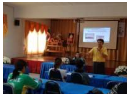
อบรมให้ความรู้สำหรับผู้ประกอบการร้านอาหาร แผงลอยจำหน่ายอาหารในพื้นที่เทศบาลตำบลกลางเวียง