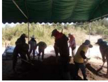
รณรงค์ทำปุ๋ยหมักใช้ในชุมชน ส่งเสริมให้ประชาชนในพื้นที่หลีกเลี่ยงการใช้สารเคมีทางการเกษตร