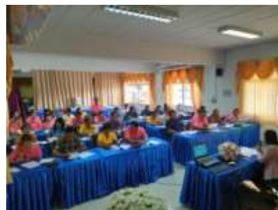
ประชุมทำความเข้าใจโครงการฯ แก่ผู้นำชุมชน และประธาน อสม.