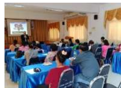
อบรมให้ความรู้เพิ่มศักยภาพในเรื่องสุขลักษณะของสถานที่เสสมอาหาร รวมถึงการขอรับใบอนุญาตประกอบการ การขอหนังสือรับรองการแจ้ง รวมถึงกฎหมายที่เกี่ยวข้อง