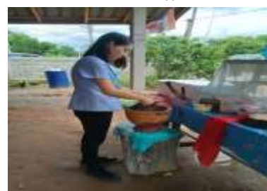
ออกตรวจประเมินสุขลักษณะของสถานที่จำหน่ายอาหาร แผงลอยจำหน่ายอาหาร การจัดระเบียบความสะอาด ความเป็นระเบียบเรียบร้อย ตามบทบัญญัติ “กฎกระทรวงสุขลักษณะของสถานที่จำหน่ายอาหาร พ.ศ. 2561” และตรวจสอบสารปนเปื้อนเชื้อโคลิฟอร์มแบคทีเรีย