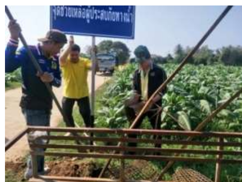
กิจกรรมติดตั้งป้ายเตือนภัยพื้นที่เสี่ยง